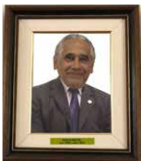
Bosco Maciel Gestão nov / 2023 a dez / 2024