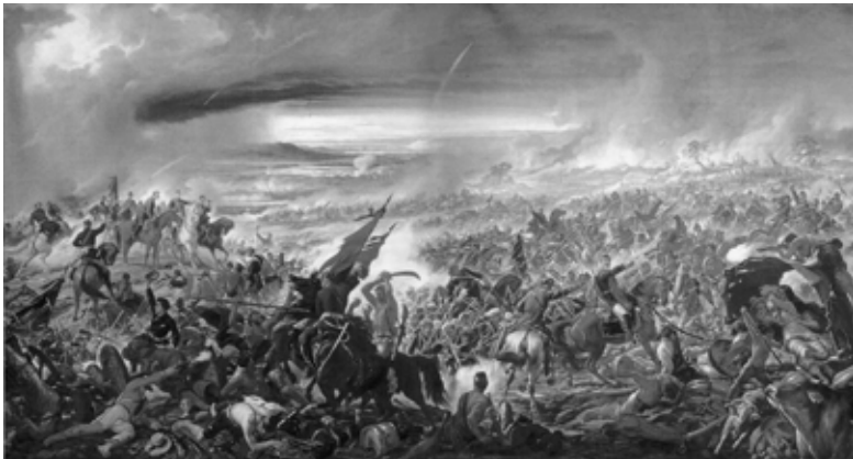
Obra "A batalha do Avaí", de Pedro Américo, 1872 (Domínio Público).