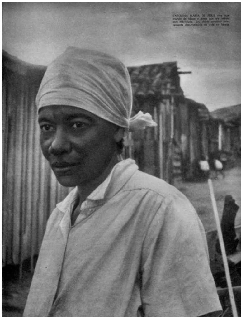
CAROLINA MARIA DE JESUS vive num mundo de fome e dor, que ela retrata com fidelidade. Seu diário constitui uma relevante documentação do vida no favela.